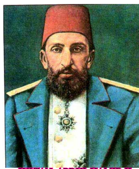
SULTAN ABDUL HAMID II

Write so that whoever wants to wake up, will wake!