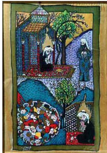
A depiction of the story of the Prophet Lot (A.S.)