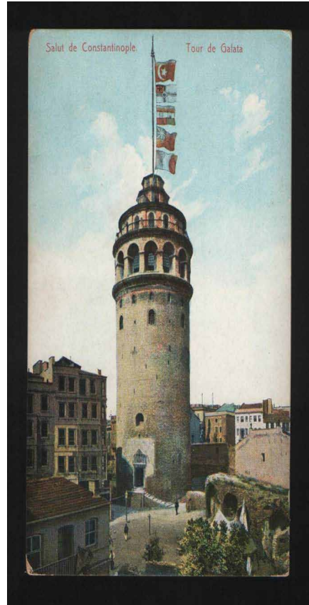
The Galata Tower in Istanbul