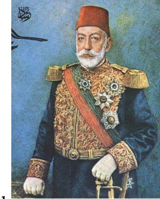
V.Mehmet Raşad Han

Ve bu sancak altında düşmanı kahredenler acaba yalnız Türkler mi idi?... (devamı 3.s)