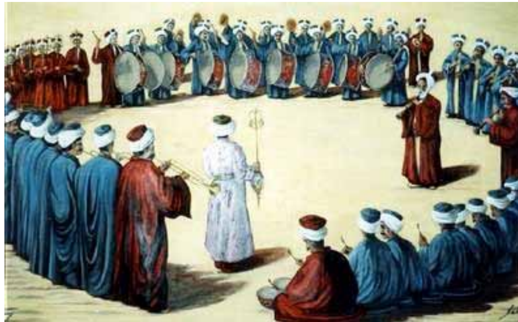
MehterTakımı-a Janissary band of musicians, celebrating the heroic achievements of the Empire