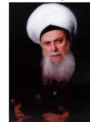
Mawlana Sheikh Nazim