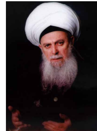
Mawlana Sheikh Nazim

VOL. 2, ISSUE 5: 24 RABI AL-AKHİR 1431 9 APRIL 2010