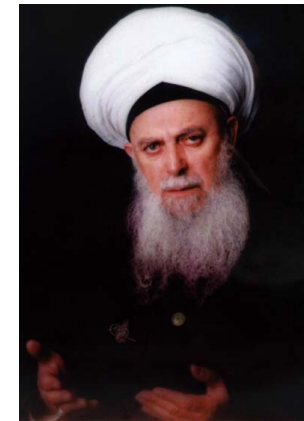
Mawlana Sheikh Nazim