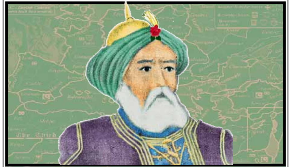
Hittin gazası ile 1187'de Kudüs'ü Haçlılardan alarak Haçlıları etkisiz hale getirmiştir.