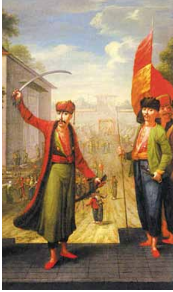
Patrona Halil (in Argos Orestikon - November 25, 1730 in Istanbul ) was the instigator of a mob uprising in 1730 which replaced one Sultan with another who then put the rebels to death.

The injustice (zulum) and tragedy that this ignoble person brought to Islam and all humanity was punished shortly thereafter by Allah (Jalawa Jalalahu), Who is the