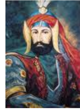
Sultan Murad Han IV

Ey irtica, sen ne mubareksin ki seni Parlamen-tolardan atmışlardır!