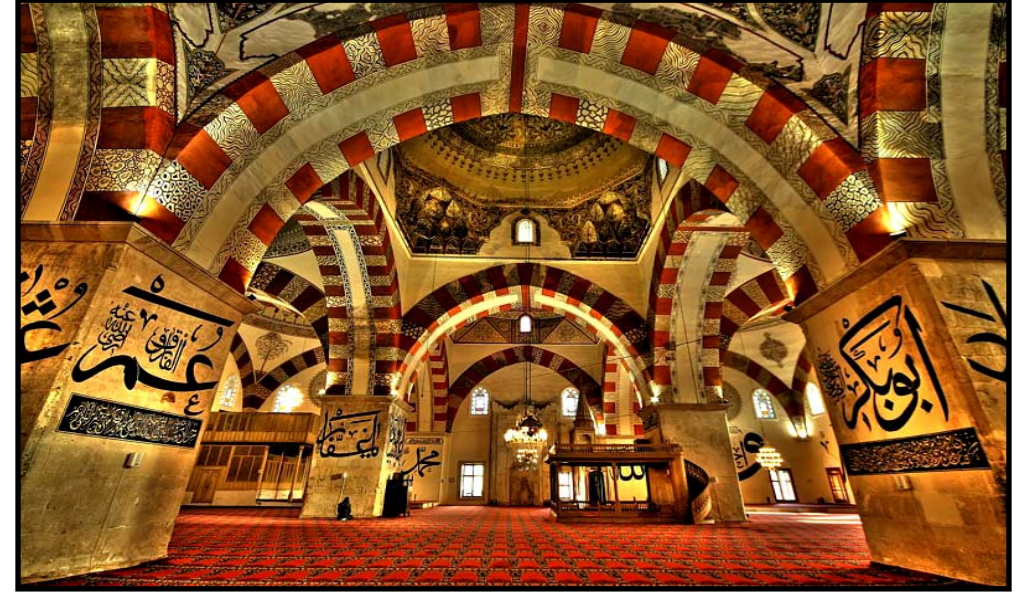
Eski Camii - Edirne