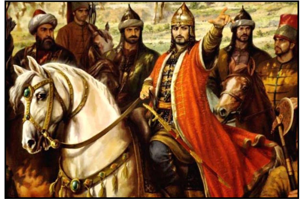
Saltanatın Azameti-Fatih Sultan Mehmet

There is no goodness coming from the scam whose heritage is un- known. They are scary bears, poisonous cobras, and bulls. May Allah damn their evil and obliterate their names.