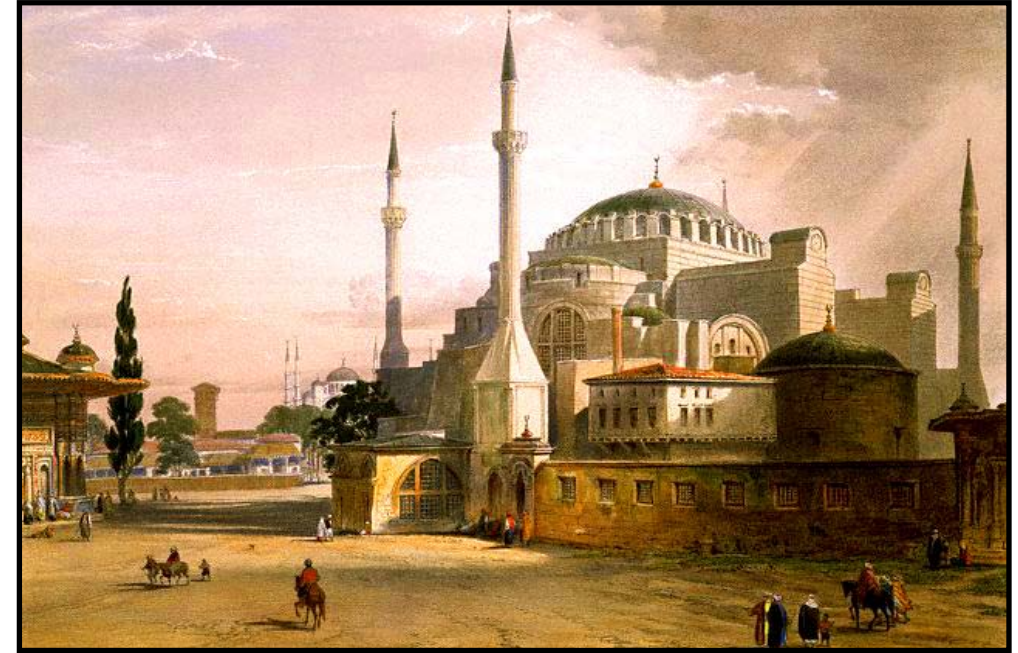
Aya Sofya Camii, İstanbul