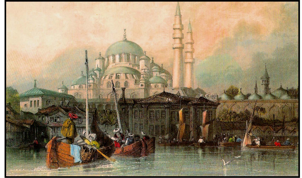
Yeni Cami - İstanbul

21st century Man is constantly seeking more and more freedom and that is why the man of today cannot decide on what he wants to do.