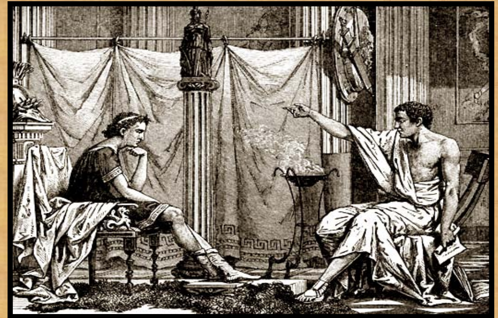
Büyük İskender hocası Aristo ile