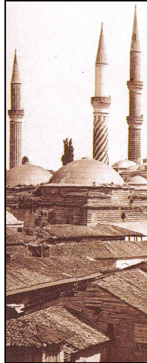
Üç Şerefli Camii (Yaklaşık 1895)